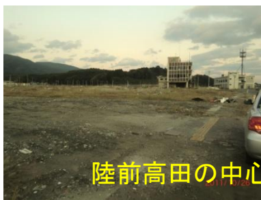
陸前高田の中心市街は地一面更地