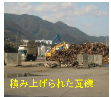
積み上げられた瓦礫