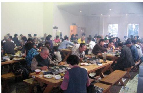
ソレイユの丘でバーベキュー