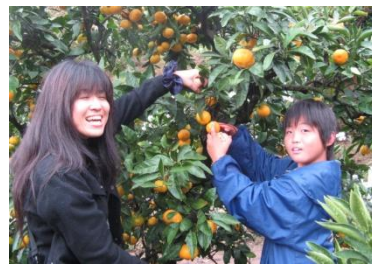
30分食べ放題！何個食べたかな？